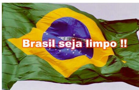
Figura 1 111