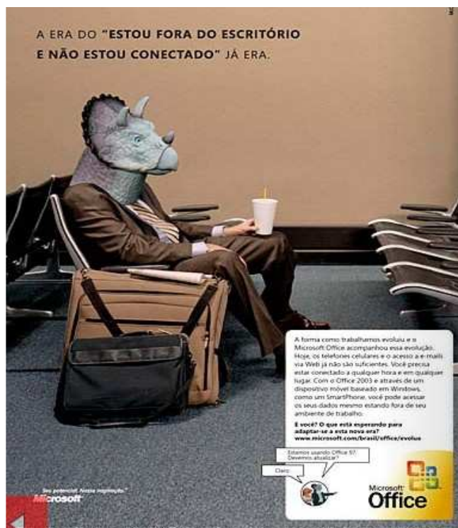
Extraído de Veja , edição 1.919, de 24 de agosto de 2005, p. 10

Uma campanha veiculada pela Microsoft em 2005, quando os smartphones ainda não haviam se difundido ao Brasil no formato como o conhecemos hoje, exemplifica com precisão não apenas a adaptação, como o incentivo da tecnologia a aspectos da cultura corporativa que determinam a extensão das horas de trabalho além do expediente.