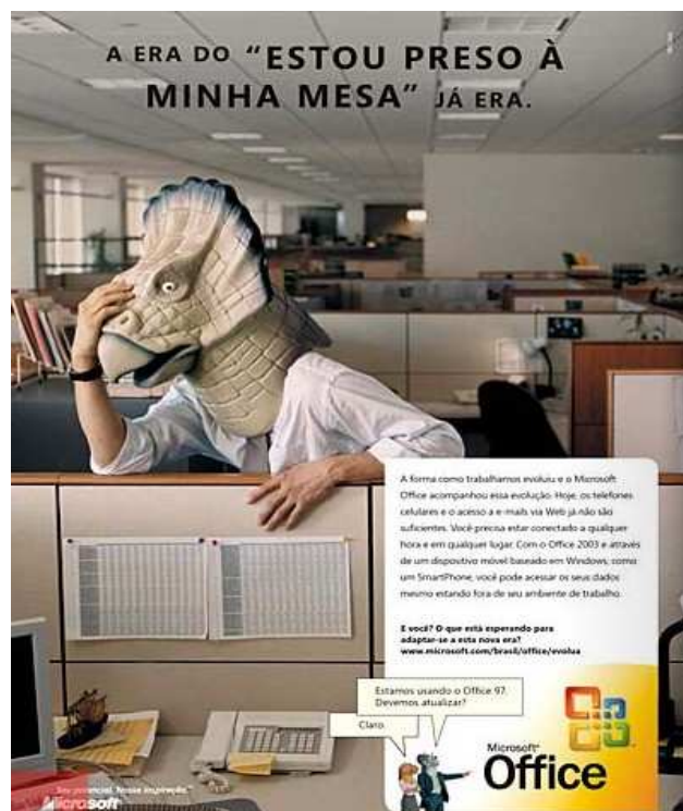
Extraído de Veja , edição 1.921, de 7 de setembro de 2005, p. 10