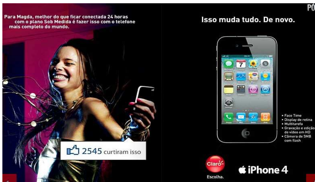
Extraído da Veja, edição 2.184, 29 de setembro de 2010, p. 36 – 37

Como os jovens constituem grande parte dos usuários das redes sociais e sua imagem tem facilidade para refletir ideais de beleza, vivacidade e disposição, eles são personagens perfeitos para a transmissão de mensagens de socialização bem-sucedida nas propagandas de smartphones . O comercial da quarta versão do iPhone, veiculado pela Claro em 2010, ressalta duplamente a valorização da exibição do indivíduo na contemporaneidade, ao exaltar a capacidade da câmera do aparelho de tirar fotografias do próprio usuário e mostrar que um número altíssimo de pessoas em uma rede social avaliou bem a imagem em questão.