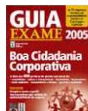
Figura 11 Capa do Guia Exame de 2005

Uma iniciativa que se assemelha é o Guia da Boa Cidadania Corporativa (Figura 1), que já está sua sexta edição anual, lançado pela Revista Exame, do Grupo Abril, em conjunto com o Instituto Ethos. Na edição de dezembro de 2005, 20 empresas foram reconhecidas “por integrar a responsabilidade social às suas estratégias de negócios” 73 : 10 empresas consideradas modelo em responsabilidade empresarial, duas vencedoras consideradas destaques regionais e outras 12 que melhor se classificaram nas sete categorias do anuário.