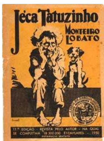
Ilustração 1 Capa do almanaque

No Brasil, proliferaram almanaques de laboratórios, saídos das gráficas que imprimiam os rótulos dos medicamentos. Eram mais que um veículo de propaganda; estabeleceram-se como material de leitura. Afinal, mais que consumidores, buscavam leitores. Neste universo, o Almanaque Biotônico Fontoura é, sem dúvida, o mais importante deles. Impulsionado pelo sucesso do folheto Jecatuzinho (ilustração 1), distribuído anteriormente pelas farmácias, o primeiro número saiu em 1920, elaborado e ilustrado por Monteiro Lobato, com uma tiragem de 50 mil exemplares. Durante muitíssimos anos, das décadas de 30 a 70, o número de exemplares impressos e difundidos do livro do autor de América oscilou entre dois e três milhões e meio. Desde a primeira edição até os anos 70, o Laboratório Fontoura recebeu diariamente uma média de 30 cartas de leitores interessados em seu almanaque (PARK, 1999):