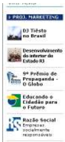
Figura 13 Localização no Globo On line

redação em fevereiro deste ano. A Infoglobo decidiu bancar, mesmo sem patrocínios. Mas já temos Coca-Cola; Furnas e Firjan como patrocinadores”.